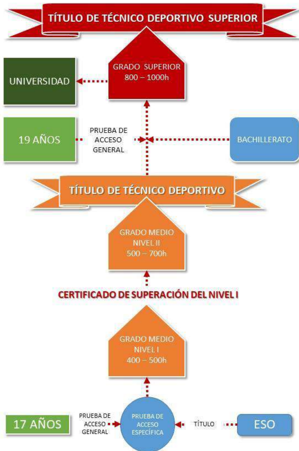
Ilustración 3 EDRE