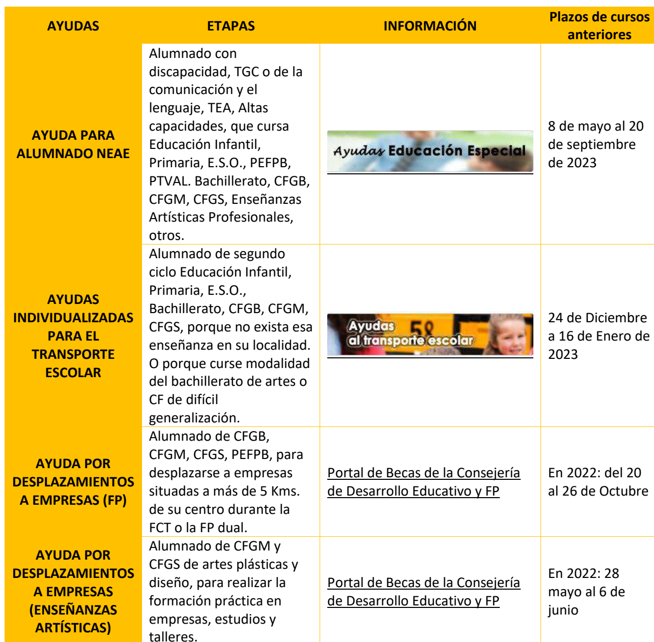
Tabla 27 Ayudas al estudio