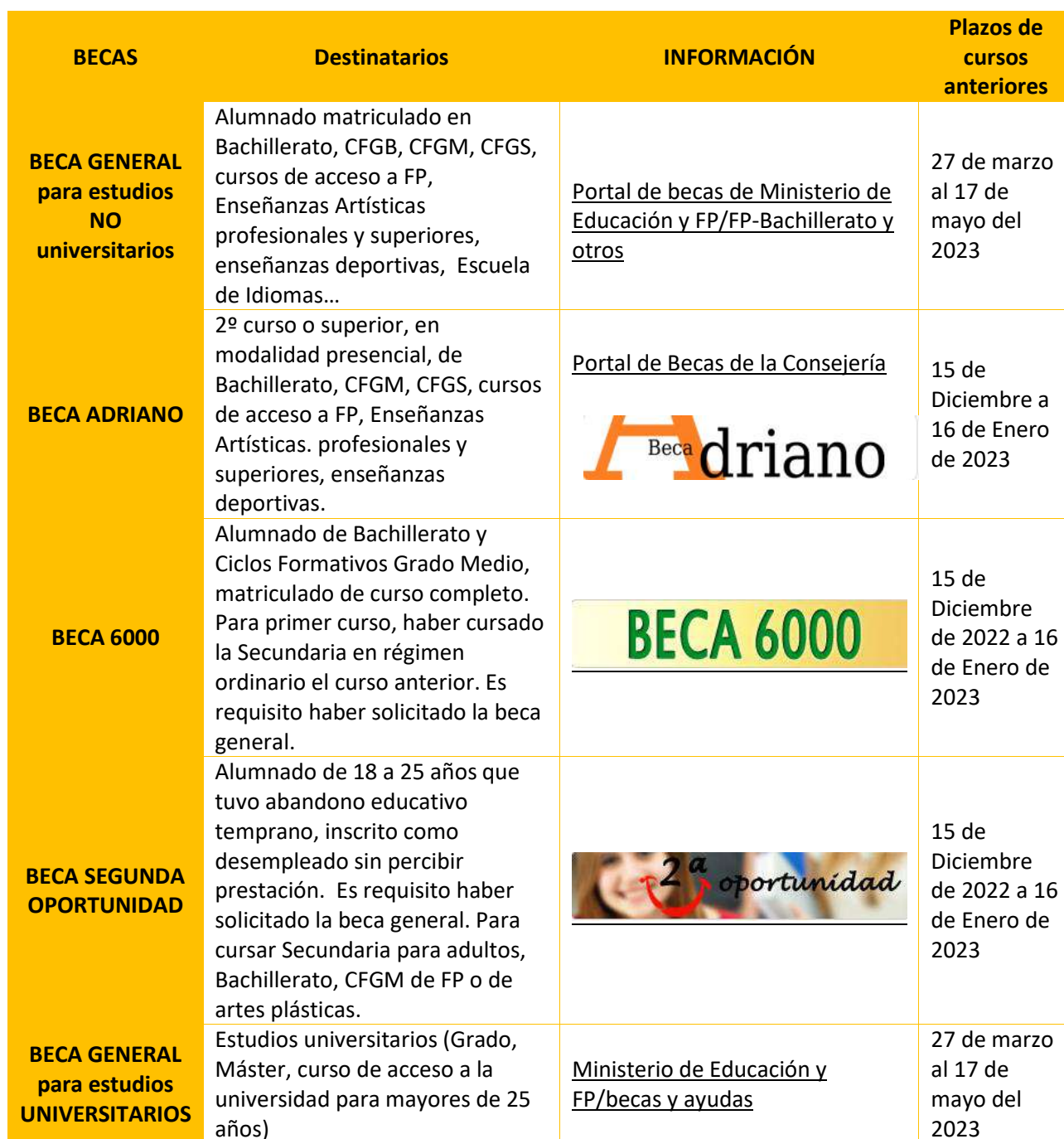
Tabla 26 Becas generales